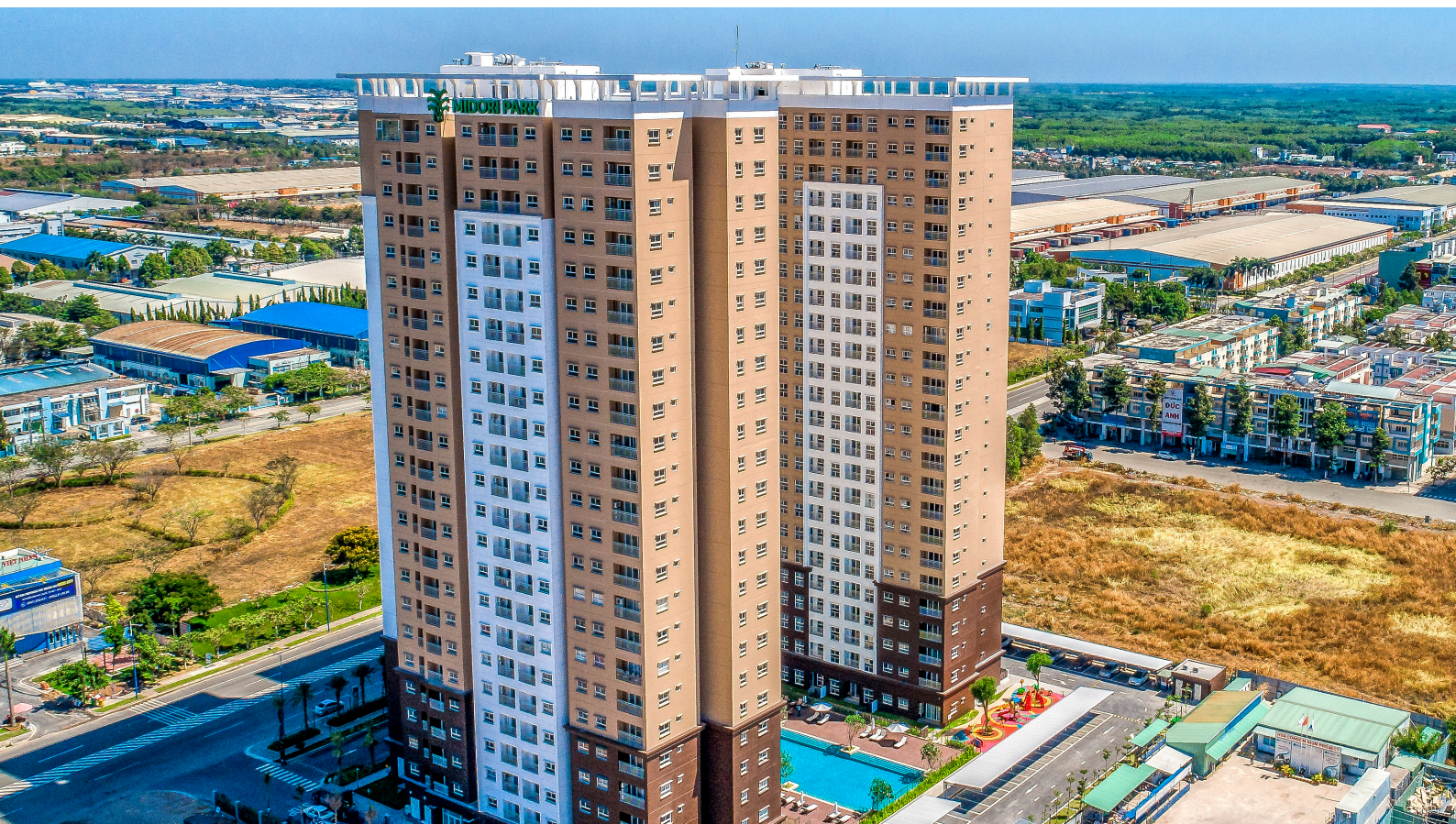
MIDORI PARK The VIEW