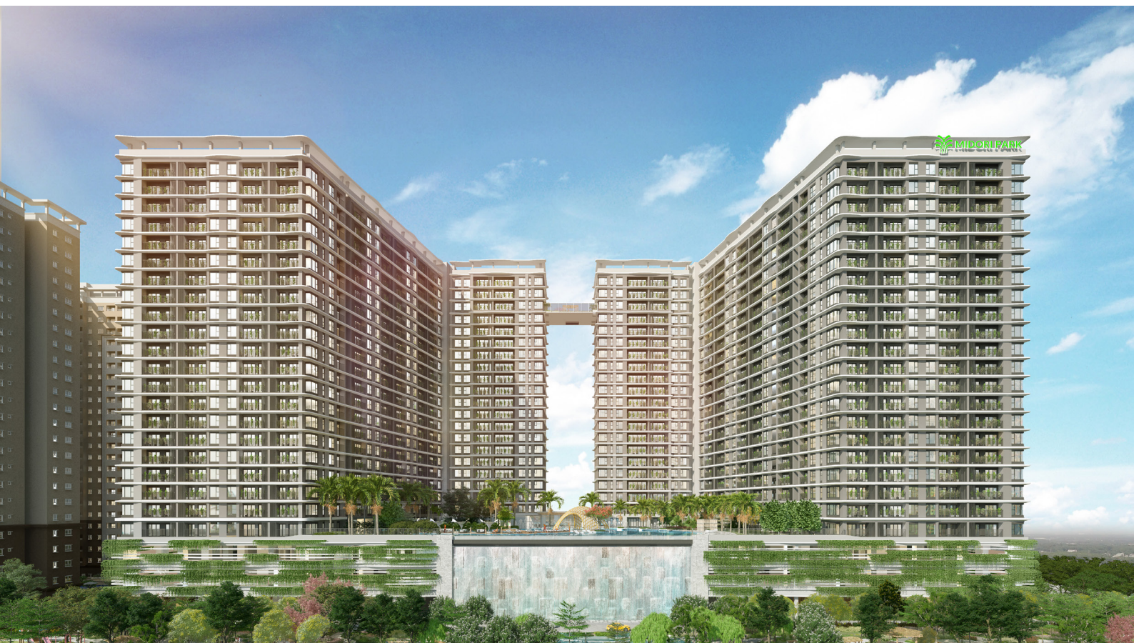
MIDORI PARK The GLORY ( Up-coming Project )