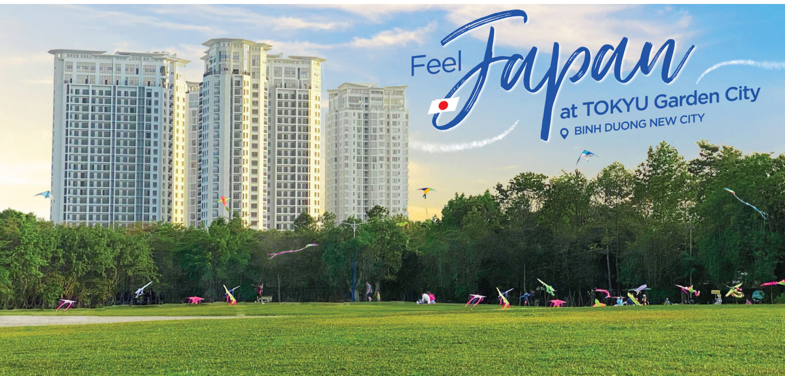
SORA gardens I & II